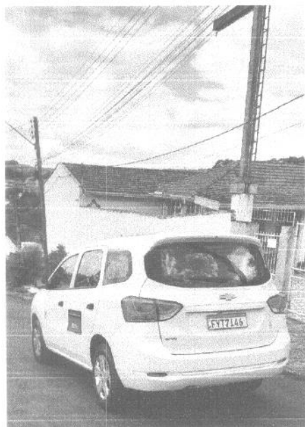
Figura 01: Vista traseira do veículo adquirido com o recurso.