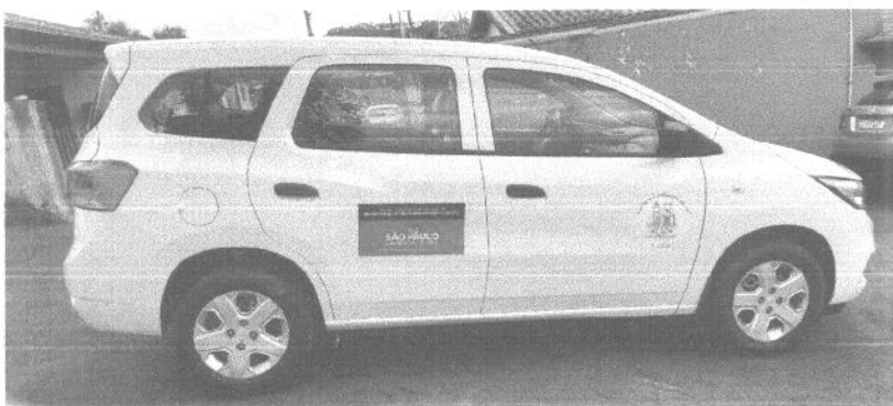
Figura 03: Vista lateral do veiculo adquirido com o recurso e o adesivo da OSC.