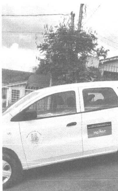
Figura 04: Vista lateral do veiculo adquirido com o recurso.