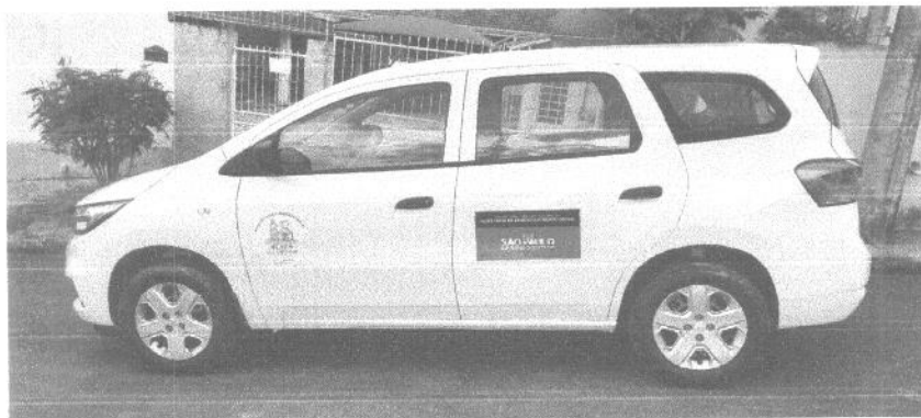
Figura 02: Vista lateral do veículo adquirido com o recurso.